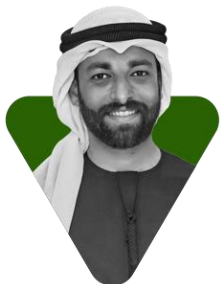
Prince Ahmed Khaled